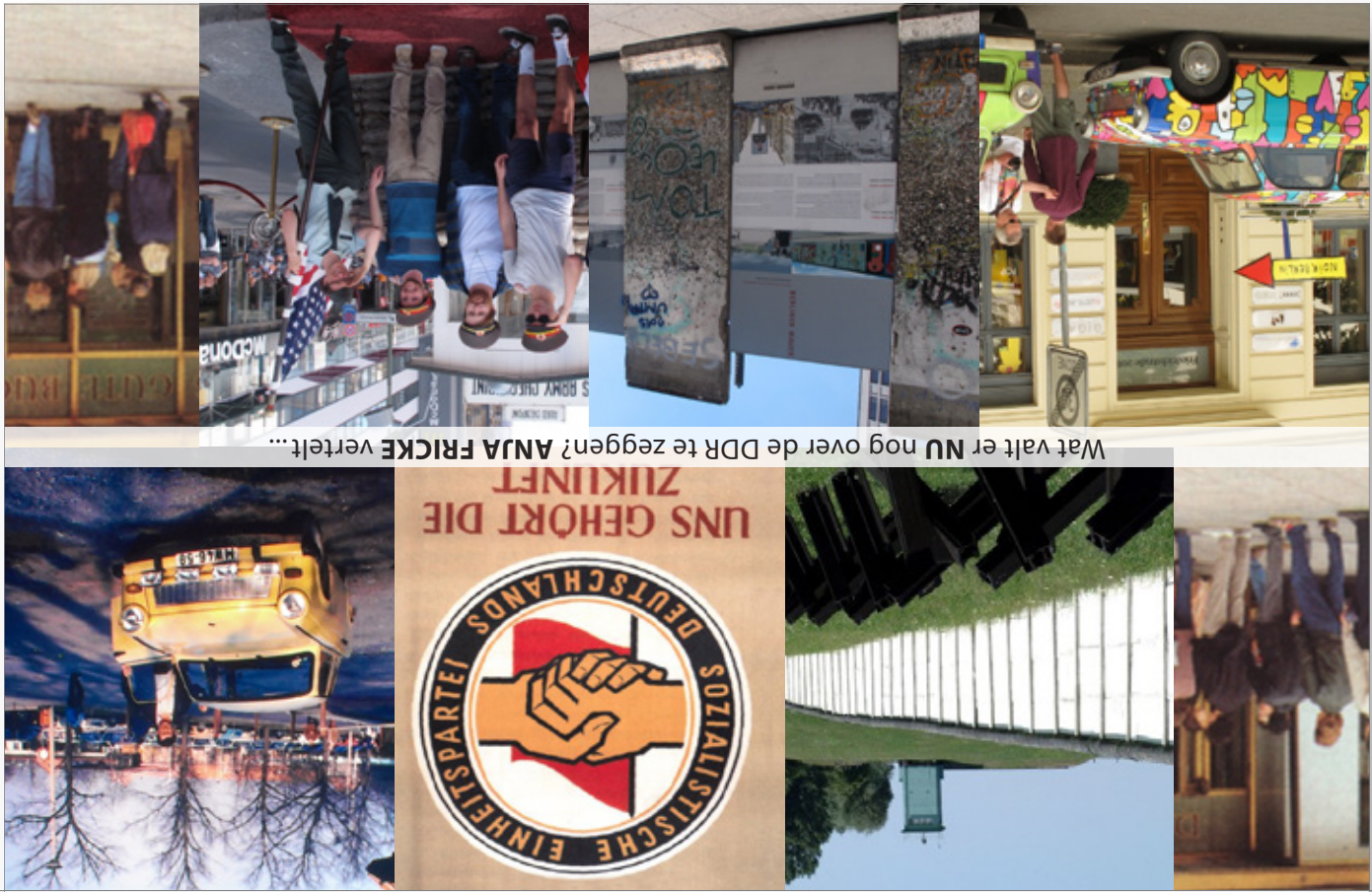
Wat valt er NU nog over de DDR te zeggen? ANJA FRICKE vertelt...